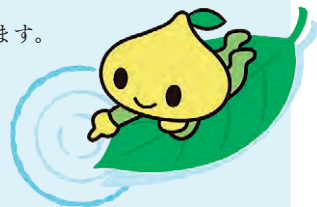
公式キャラクター ビットくん