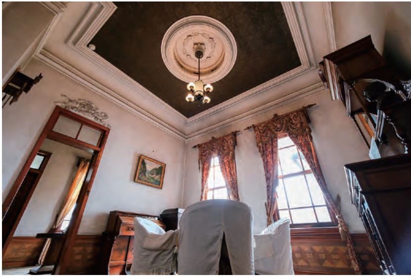
旧林家住宅 (入館料大人 590 円、子ども 270 円。9 時～16 時 30 分開館、水曜・祝翌日・年末年始は休館、冬季は変動あり) 岡谷市御倉町 2-20