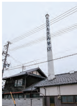
岡谷市内には 9 軒の味噌蔵がある。煙突が目印の「サスキチ味噌」は 1804 年創業の老舗 岡谷市中央町 2-6-5

岡谷市はまた、うなぎのまちでもあります。かつて諏訪湖まで遡上するうなぎは天竜川に仕掛けた梁で獲られ、この地の名物となりました。今も多くのうなぎ店や川魚店が点在しています。