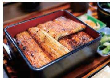
うなぎを背開きでさばき、蒸さずに焼く。関東と関西の折衷が岡谷流

岡谷市街には、製糸業の発展を伝える近代化産業遺産がいくつも残されています。そのひとつ「旧林家住宅」は、片倉や尾澤と並ぶ製糸家だった林国蔵の邸宅です。明治 30～40 年代築の建物は主屋と離れ、土蔵から成り、離れは洋館と座敷が隣り合わせの造りで、洋館の奥は茶室