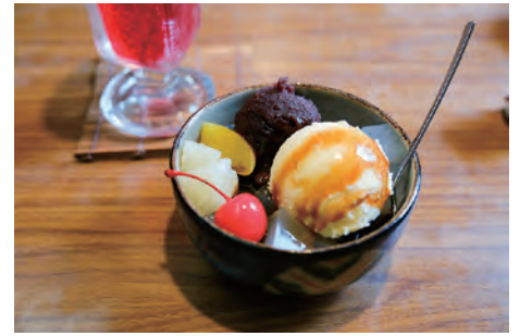
晴山堂茶寮 (せいざんどうさりょう) は 1925 (大正 14) 年創業の和菓子店。現在はイトインのみ営業 (12～19 時、水曜定休) 岡谷市塚間町 1-1-4

蚕 糸業は明治時代から昭和初期まで日本の基幹産業であり、日本は世界一の「生糸」輸出国でした。長野県は繭も生糸も日本一の生産量を誇り、なかでも諏訪・岡谷地方は蚕糸業のうち繭から糸を繰って生糸をつくる「製糸」で大きく発展しました。