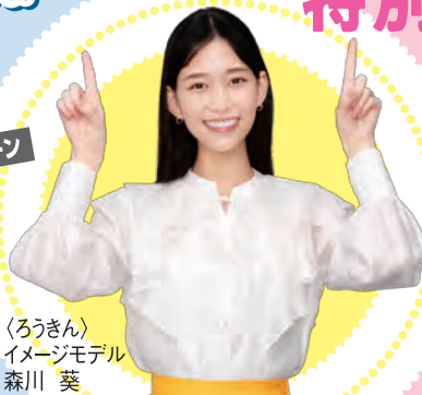
(ろうきん) イメージモデル 森川 葵

●他の金利優遇制度との併用はできません。●当金庫にすでにお預け入れいただいている定期性預金からの書替または振替は対象外とさせていただきます。●中途解約の場合は、当金庫が定める預入期間に応じた中途解約利率を適用いたします。●やむを得ない事情により、キャンペーン内容が変更・終了となる場合があります。●取扱期間中であっても、金利情勢が大幅に変化した場合には、新規申込の受付を中止することがあります。また金利情勢により、適用金利が変更になる場合があります。●店頭で説明書をご用意しております。詳しくはお近くの〈長野ろうきん〉にお問い合わせください。 2026年5月1日現在